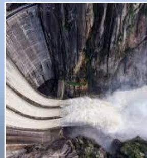
Ley de Hidroelectricidad