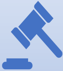
Ley de Aguas