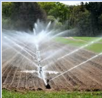
Ley de Riego