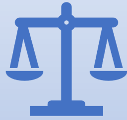
Ley de Agua Potable y Saneamiento